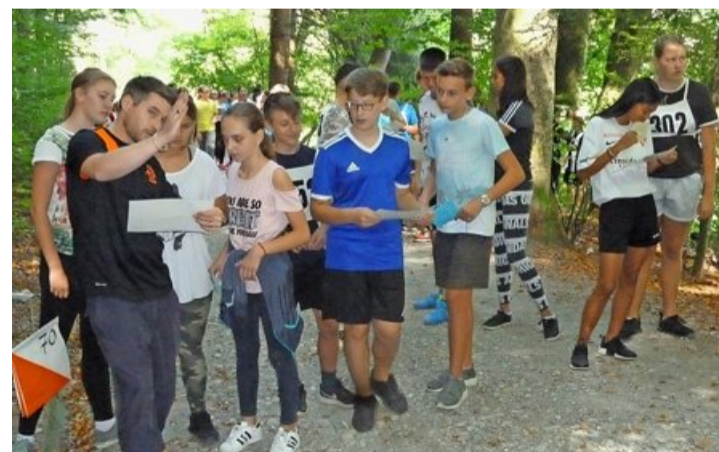
Schülerinnen und Schüler der OS Länggasse vor dem Start.

Der alljährliche Orientierungslauf der Oberstufenschule Länggasse wurde im Schorenwald ausgetragen. Bei gewittig-warmem Spätsommerwetter und besten Geländebedingungen starteten 189 Schülerinnen und Schüler, meist in Kleingruppen. Die Lehrkräfte hatten total über dreissig der orange-weissen Fähnchen im Wald platziert, und je nach Kategorie sollten neun bis dreizehn Posten in möglichst kurzer Zeit angelaufen werden. Die benötigten Fertigkeiten wie Kartenkunde, Orientierung und