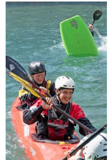
Beim Kanufahren wird man ab und zu nass...

Vor 75 Jahren wurde der Kanu-Klub Thun als Faltbootklub Thun gegründet. Deshalb wurde am Wochenende auf dem Mühleplatz ein Publikumsanlass mit allerlei Bootstypen auf die Beine gestellt. Die Besucher konnten Passagierfahrten auf der Aare geniessen, die unterschiedlichen Arten von Paddelbooten von nahem begutachten oder in Action bestaunen. Auf der Welle unter der Schleuse zeigten Wildwasserkünstler ihr Können. Im Beisein von Stadtpräsident Raphael Lanz (SVP) wurde eine Parade der unterschiedlichen Wasserfahrzeuge präsentiert. Danach liess es sich der Stadtpräsident nicht nehmen, mit dem Präsidenten